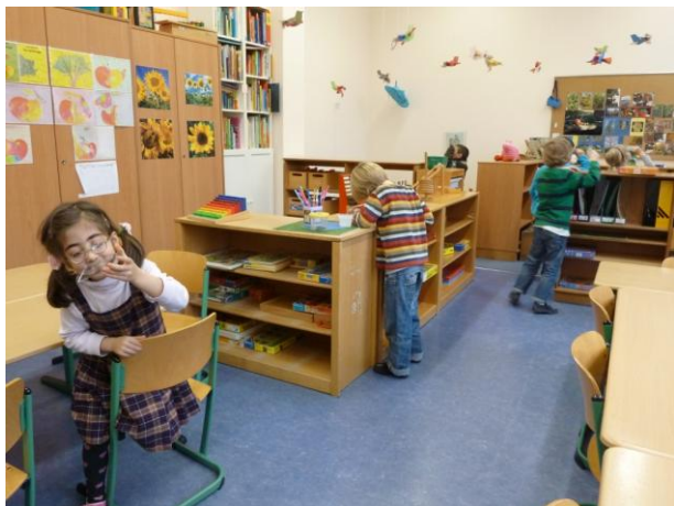
Ausschnitt unseres Vorschulclassenraums im Erdgeschoss

In unserer Vor- und Grundschule lernen Kinder mit unterschiedlichen Begabungen und unterschiedlichen Lernvoraussetzungen und Kinder aus unterschiedlichen Kulturen mit verschiedenen Sprachen gemeinsam in einer Klasse.